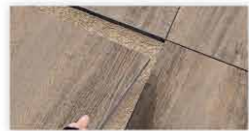
Posa su sabbia Installation on sand Verlegen auf Sand