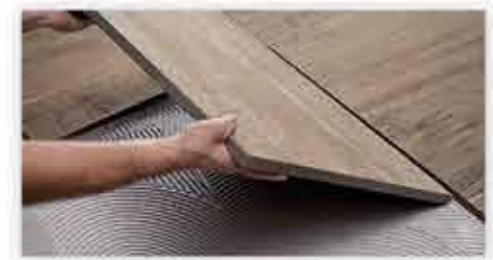
Posa su colla Installation with adhesive Verklebung auf Einkornmörtel