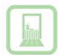
Terrazze Terraces Terrassen

Outdoor, Die neue Dimension des Lebens im Freien. Feinsteinzeug in 2 cm Dicke mit allen Vorteilen von Feinsteinzeug und ganz neuen Verlegungsmöglichkeiten im Freien. Eine neue Dimension, die Sie überraschen wird.