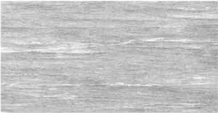
ATROX Gneis grigio