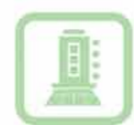
Esterni alberghi Hotel grounds Außenbereiche von Hotels