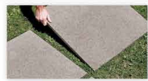
Posa su erba Installation on grass Verlegen auf Rasen