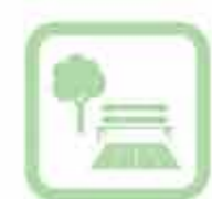
Gardens/camminamenti Gardens/pathways Gärten/Gelwege