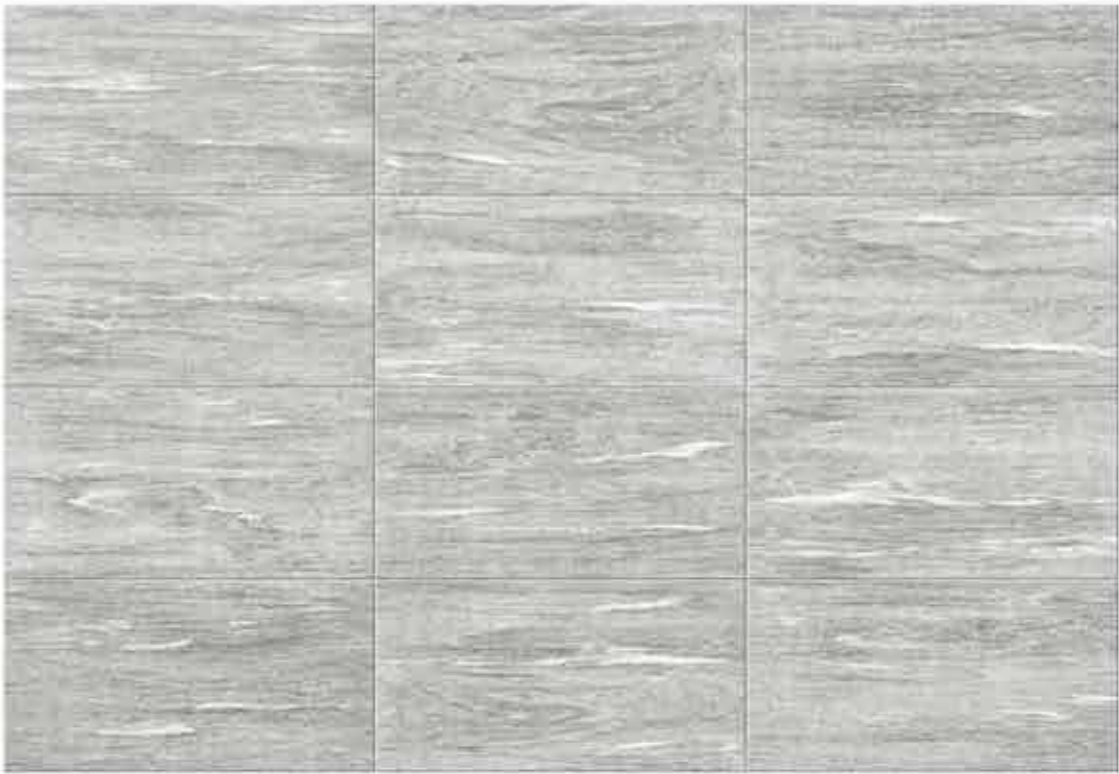
ATROX Gneis grigio