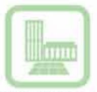
Aree commerciali/industriali Industrial/commercial areas Gewerbe-/Industriebereiche