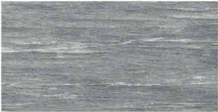
ATROX Gneis anthrazit