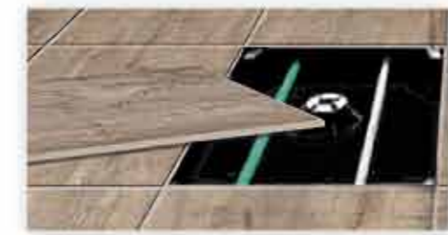
Posa sopraelevata Raised installation Verlegen auf Stelzlager

Outdoor, la nuova dimensione del vivere all'aperto. Gres porcellanato di spessore 2 cm con tutti i vantaggi del gres e inedite possibilità di posa in esterni. Una nuova dimensione che vi sorprenderà.