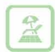
Spiagge/Stabilimenti balneari Beaches/Beach resorts Strände/Badenanlagen