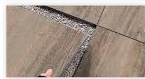
Posa su ghiaia Installation on gravel Verlegung auf Splitt